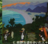
E. 熊野古道を歩いた人々

常設展示室 熊野古道とその周辺地域の自然・歴史・文化を、資料や映像等でわかりやすく紹介し、熊野の魅力をお伝えします。