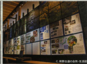
C. 熊野古道の自然・生活誌