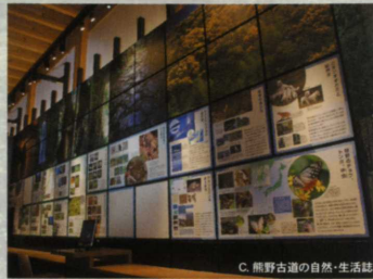
C. 熊野古道の自然・生活誌