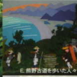
E. 熊野古道を歩いた人々